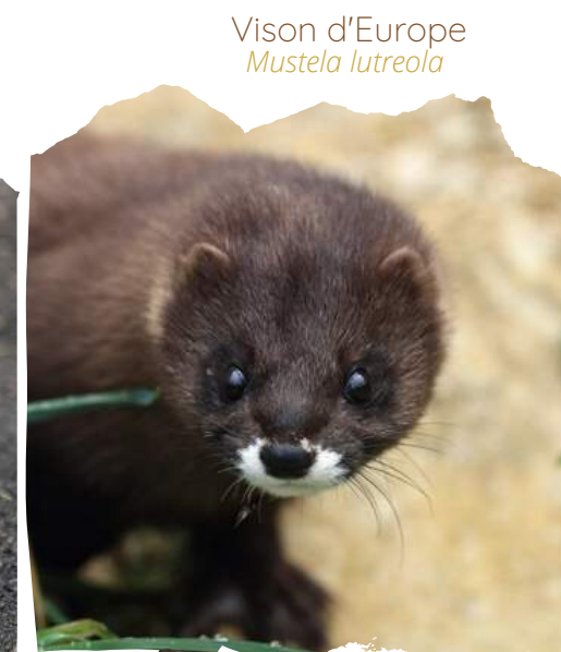
Vison d'Europe Mustela lutreola