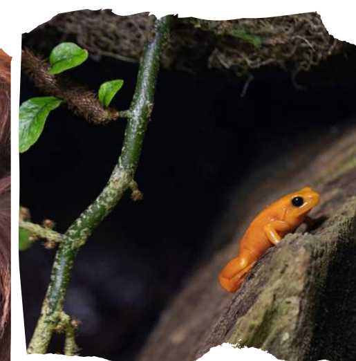
Mantelle dorée Mantella aurantiaca