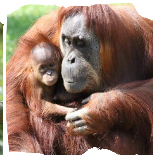
Orang-outan de Sumatra Pongo abelii