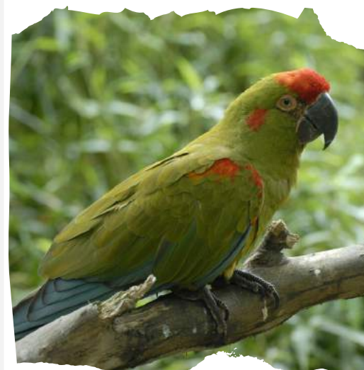
Ara de Lafresnaye Ara rubrogenys