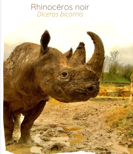
Rhinocéros noir Diceros bicornis