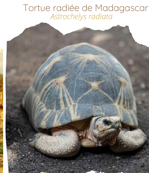
Tortue radiée de Madagascar Astrochelys radiata